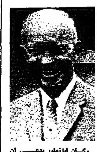
وكان ايزنهاور يدعي ان الدنيا للخطر النووي - واما هو ( ايزنهاور ) فعامل حريص على السلام